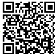
陽性者登録センターHP