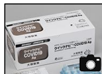
添付イメージ（製品名）