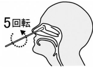
鼻腔ぬぐい液採取